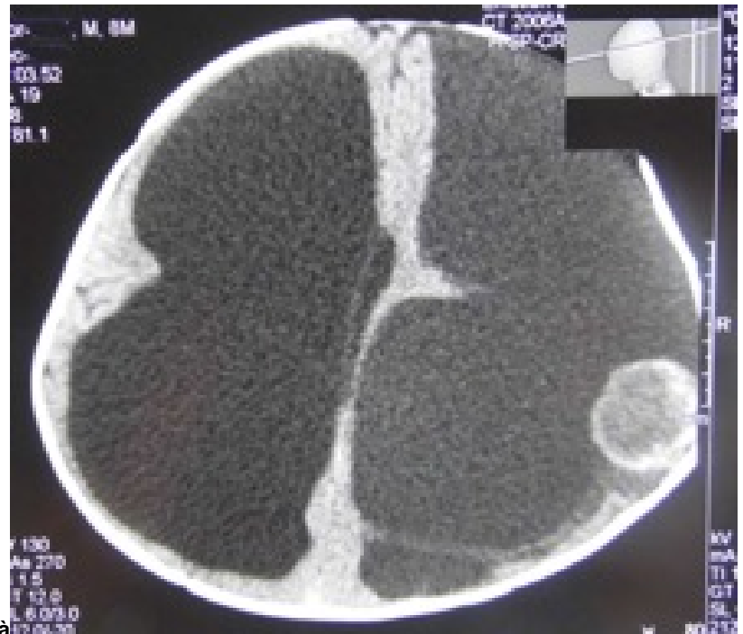
Figura 2. Tomografia computerizzata a 6 mesi di età